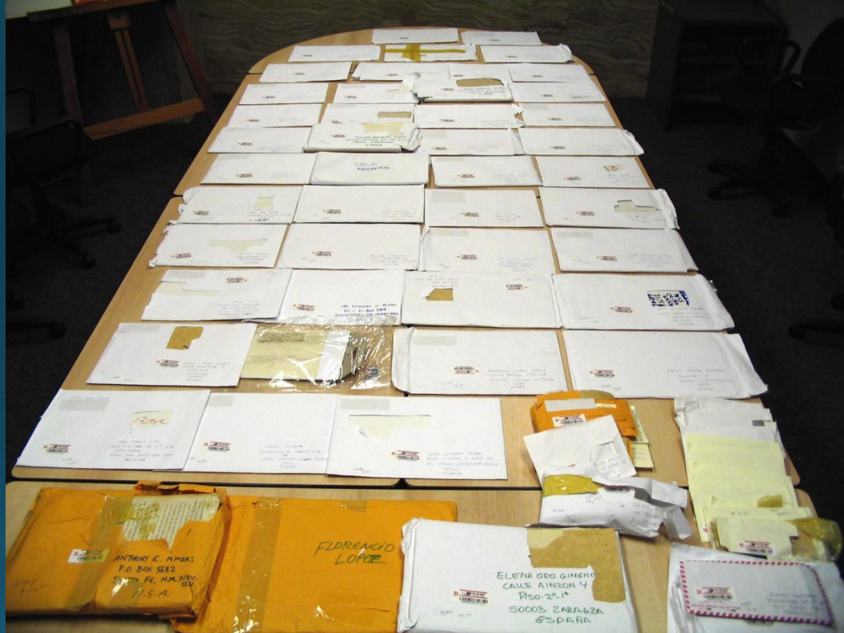
Fotografía de los sobres incautados por la policía ecuatoriana.