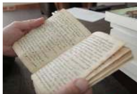
Manuscrito escrito en quechua robado en la BNP Perú y repatriado en 2016.