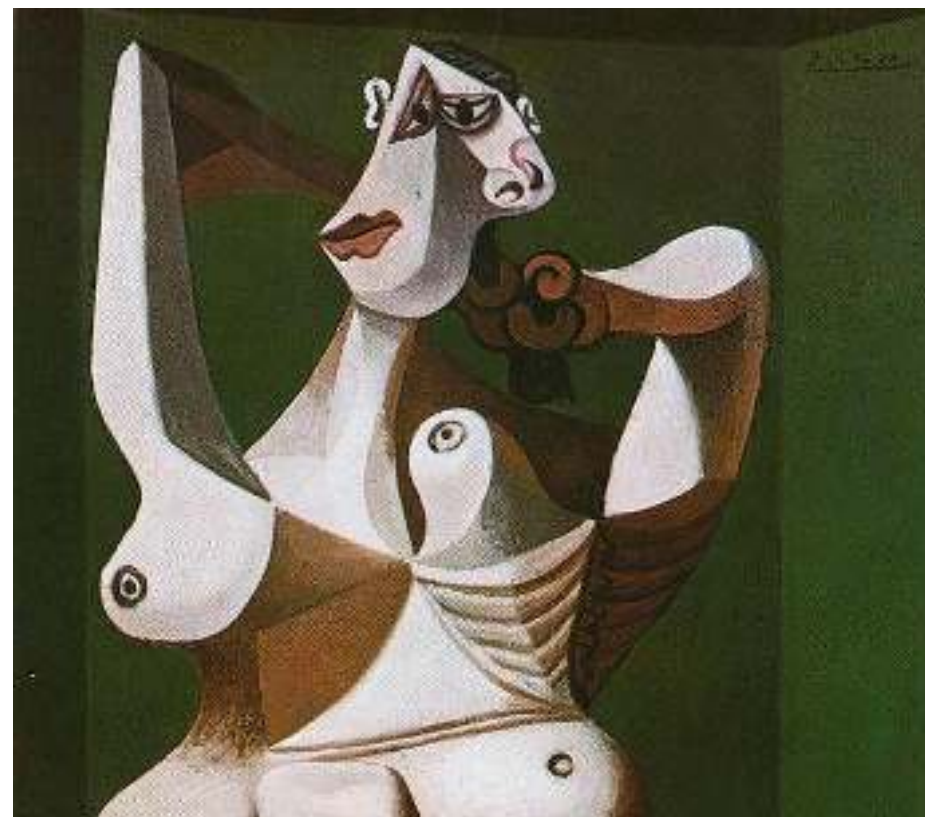
Mujer peinándose, Picasso, óleo de 1940. Incautado por la policía turca en enero del 2016. Robado en un domicilio privado de Nueva York.