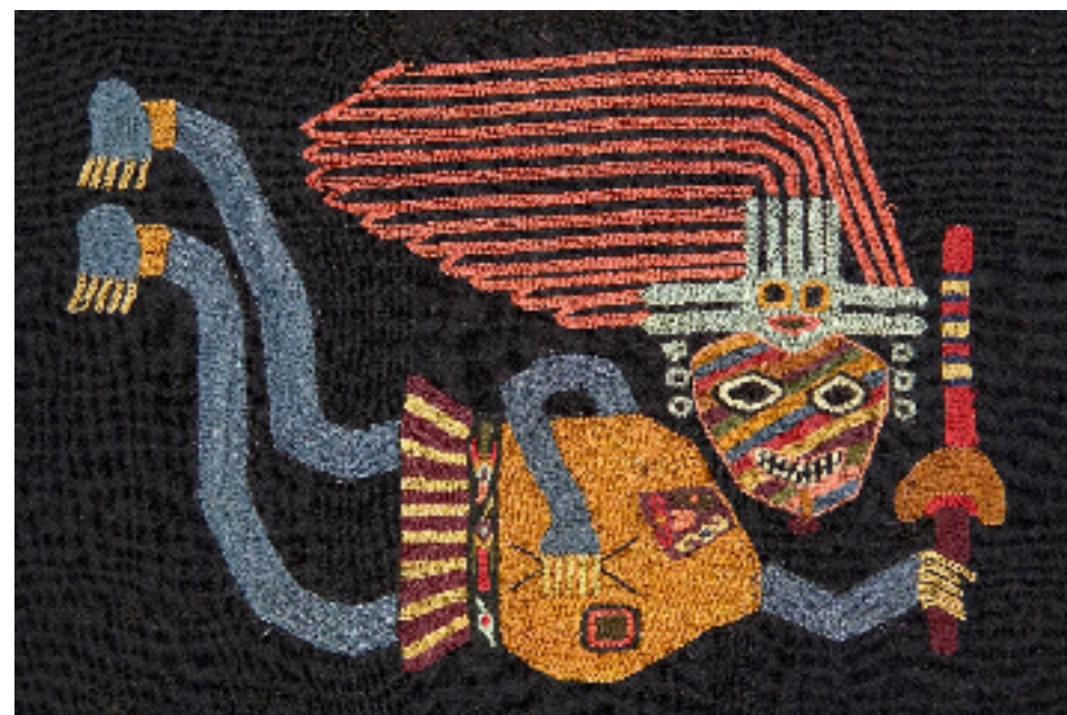
Textil de la cultura Paracas, Pisco, Ica.