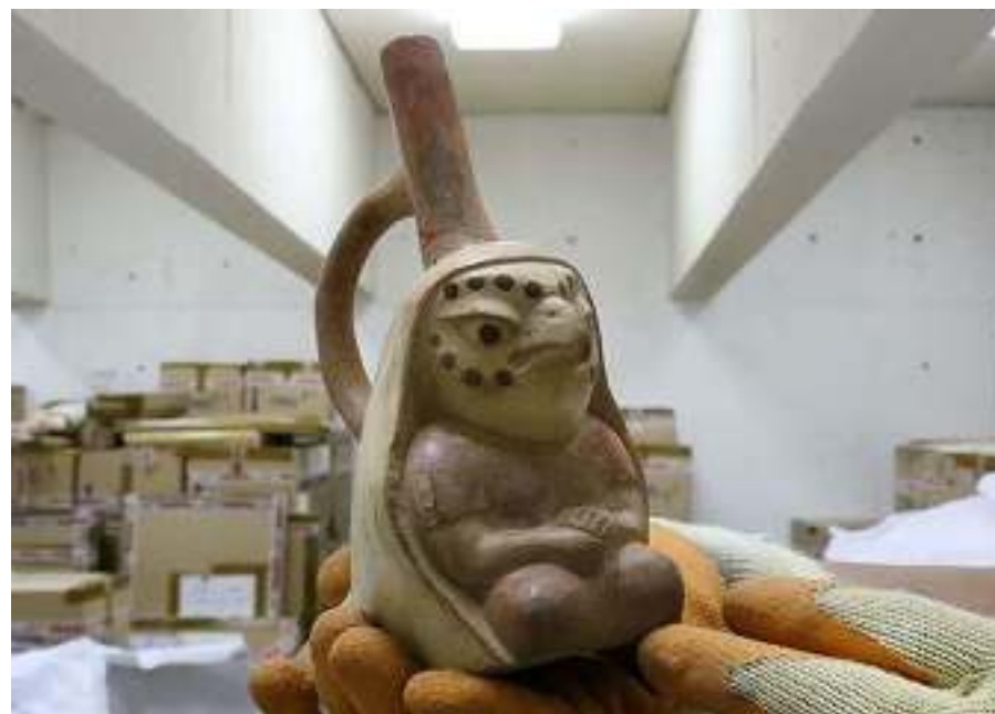
Argentina devuelve 4,150 bienes culturales al Perú (febrero 2016)

La Convención privilegia la cooperación inter-estatal y opera principalmente por vía diplomática.