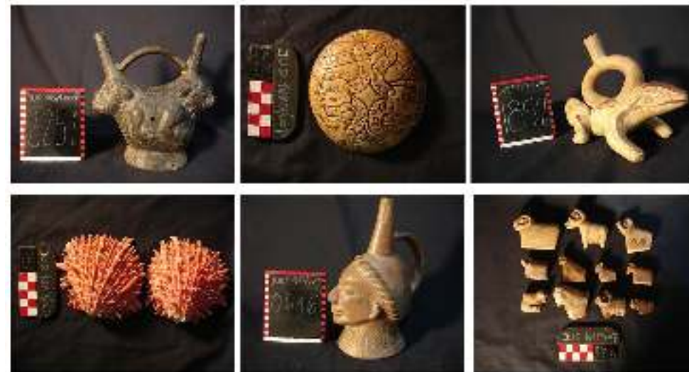
Piezas prehispánicas de culturas peruanas repatriadas de Argentina tras un juicio de 16 años.