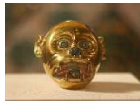
Cabeza de mono cultura Moche, Perú. Repatriada en 2011.