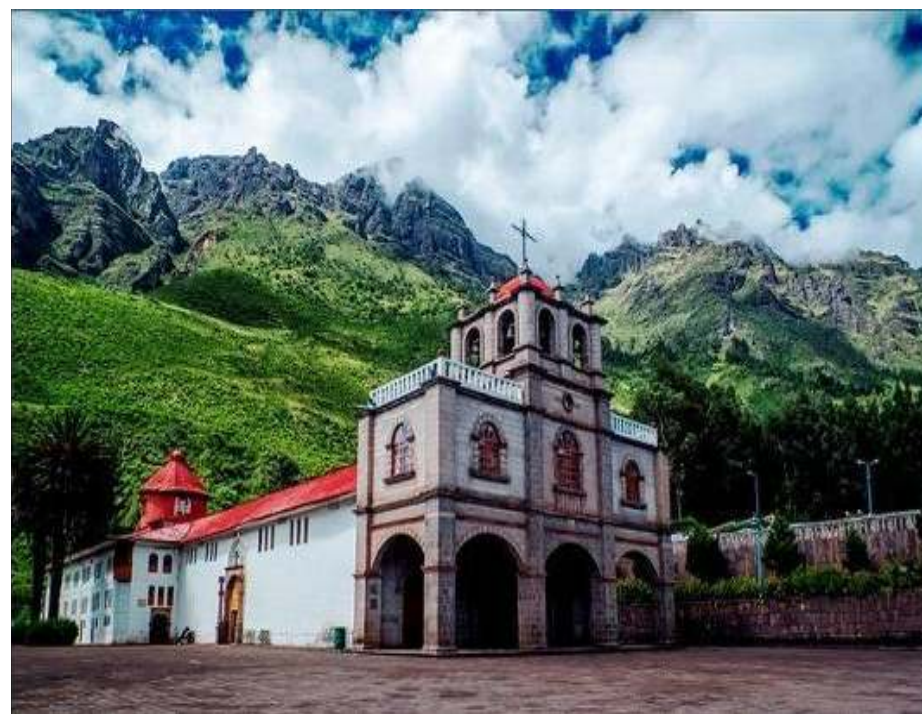
Santuario Señor de Huanca y el Apu Pachatusan, distrito de San Salvador, provincia de Calca, Cuco.