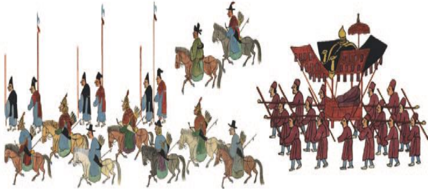
Protocolos de los ritos de la boda del Rey Yeongjo y la Reina Jeongsun.