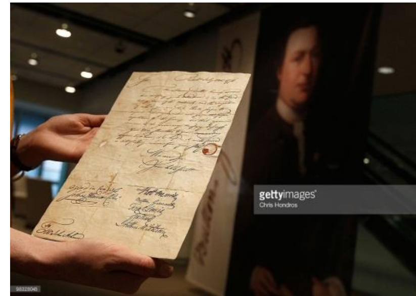
Sotheby's subasta documentos históricos raros

El robo de estos preciosísimos documentos se debe a su gran valor en el mercado y al interés de los coleccionistas de poseer este tipo de bienes.