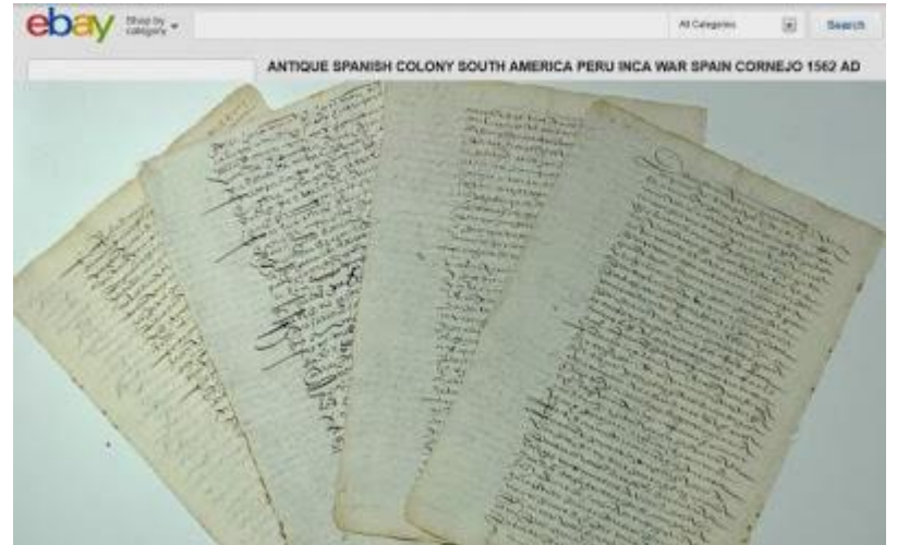
Patrimonio Documental de Perú vendido a través de eBay