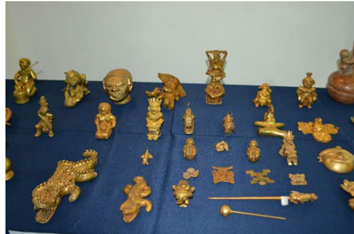
Piezas precolombinas recuperadas por la Fiscalía Nacional de Ecuador