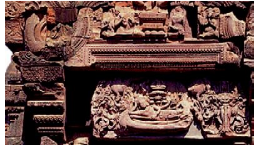
El "Dintel de Phrar Narai", que regresó a Tailandia desde los Estados Unidos en 1988.

Durante sus primeras tres sesiones, el Comité se concentró en desarrollar el Formulario Estándar relativo a las Solicitudes de Devolución o Restitución y las Directrices para su funcionamiento, que se esperaba que facilitara las muchas solicitudes que esperaba tener ante sí. Sin embargo, han sido muy pocas las solicitudes presentadas ante el Comité.