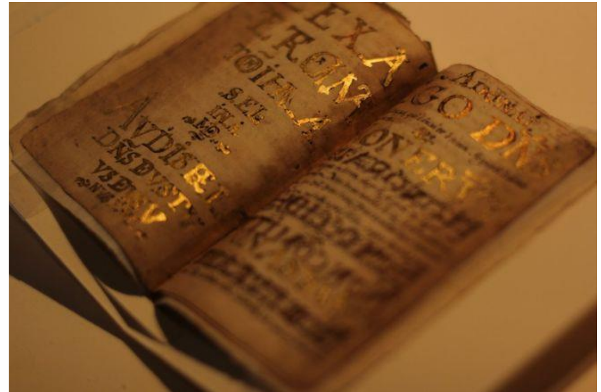
Manuscritos de Luis de Carvajal “El Mozo” Biblioteca Nacional de Antropología e Historia de México

Los archivos y sus documentos son el testimonio de lo ocurrido en un lugar y fecha determinada, dan cuenta de lo que pensaban o conocían ciertas personas en una época, nos hablan sobre la gestión que llevaban los gobiernos; y ese es el legado que han dejado grandes personas y civilizaciones a lo largo de la historia. Sin ese legado es posible que las presentes y futuras generaciones pierdan la identidad de lo que son y representan. Por ello, la conservación de la memoria histórica de los pueblos es de vital importancia.