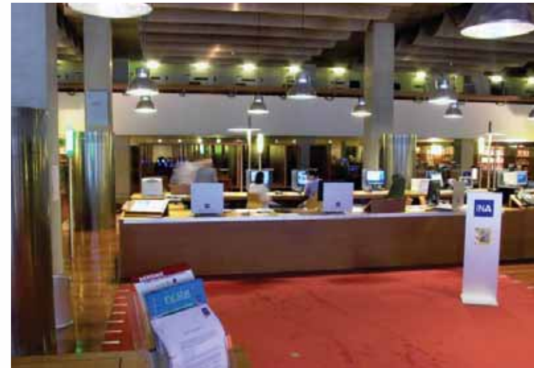
Plan d'accès au centre de consultation de l'Inathèque de France